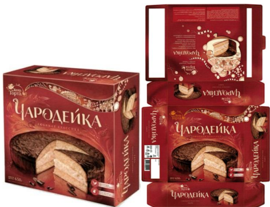
Изделие по патенту

ОТВЕТЧИК – ООО «Чаровница» производит кондитерскую продукцию. Ответчик считает, что не использует патент истца, т.к. упаковка изготавливаемого им торта не содержит все существенные признаки промышленного образца