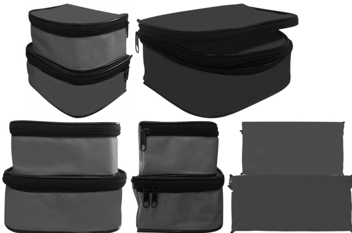
2. Футляр 1 (самостоятельная часть изделия)