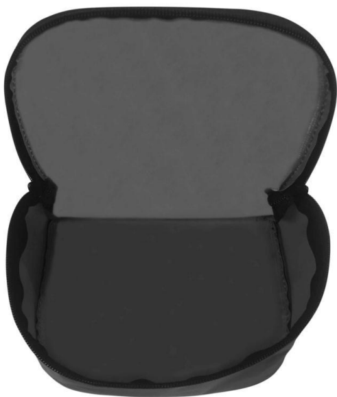
3. Футляр 2 (самостоятельная часть изделия)