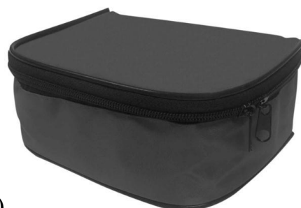
Футляр 1 (самостоятельная часть изделия)

Источник информации [4] представляет собой распечатки со скриншотами видеоролика, содержащегося в сети Интернет на видео хостинге YouTube. Указанный видеоролик опубликован на видео хостинге 15.02.2020, т.е. до даты (19.02.2021) приоритета оспариваемого патента. Даты публикации видеороликов на видео хостинге YouTube автоматически добавляются при их размещении в сети Интернет. Данный видеоролик находится в открытом доступе. Следовательно, источник информации [4] может быть включен в общедоступные сведения (см. процитированный выше пункт 55 Правил).