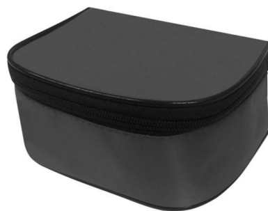
Футляр 2 (самостоятельная часть изделия)

Таким образом, совокупность существенных признаков Футляра 1 по оспариваемому патенту, нашедшая отражение на изображениях внешнего вида изделия, производит на информированного потребителя такое же общее впечатление, которое производит совокупность существенных признаков внешнего вида футляра, известного из распечатки [2], и как следствие, не обуславливает творческий характер особенностей этого изделия (см. процитированный выше подпункт 1 пункта 75 Правил).