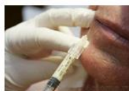
— компании «Colbar