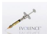
(Швеция); Филлер Evolence