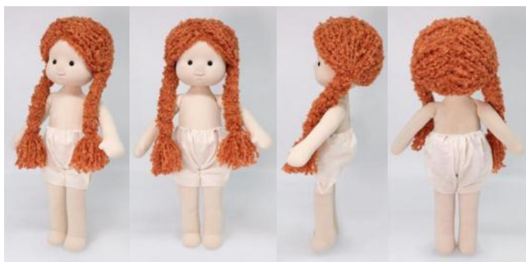
3. Кукла (вариант 3)