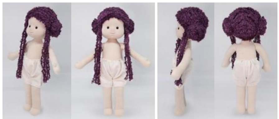
Кукла (вариант 2)

Промышленный образец по варианту 1 оспариваемого патента отличается от кукол, известных из сведений, содержащихся в источниках информации [1], [3]-[30], по меньшей мере, указанными выше признаками.