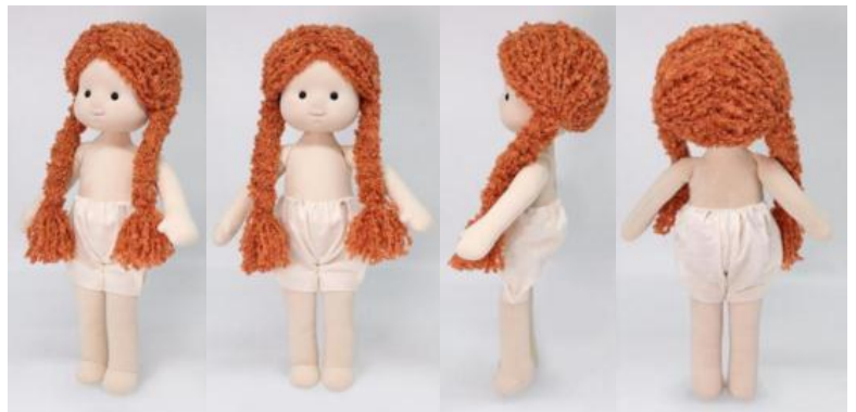
3. Кукла (вариант 3)

характеризуется следующими существенными признаками: