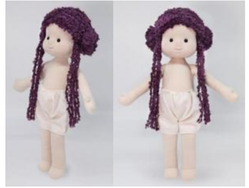
2. Кукла (вариант 2)