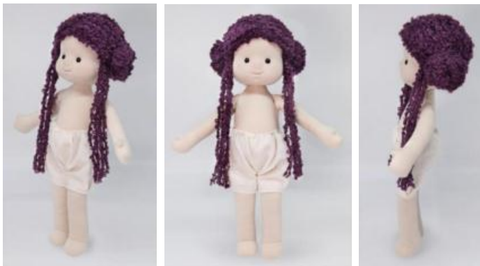
2. Кукла (вариант 2)