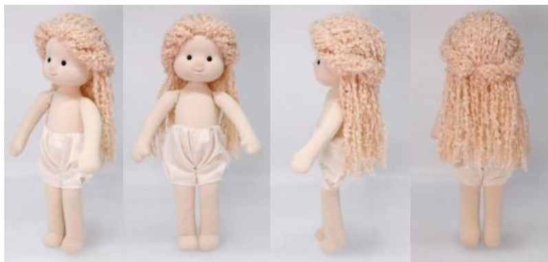
«1. Кукла (вариант 1)

Патент Российской Федерации №134066 на группу промышленных образцов «КУКЛА (3 варианта)» выдан по заявке №2022501710/49 с приоритетом от 15.04.2022. Обладателем исключительного права на патент является ИП Юсупов Рафис Ринатович (далее - патентообладатель). Патент действует в объеме следующих изображений: