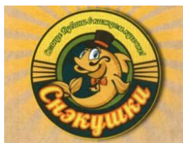
[1] « »

В решении Роспатента от 06.02.2021 обозначению по заявке №2019721048 противопоставлены следующие товарные знаки.