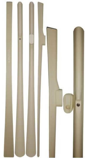
- вариант 4;

и рожок для надевания обуви, известный из видеоролика [6]