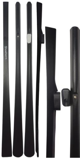
- вариант 3;