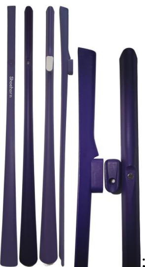
- вариант 1:

Варианты 1-4 выполнения рожка для надевания обуви по оспариваемому патенту: