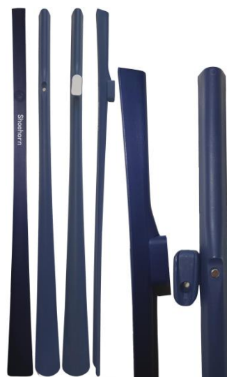
- вариант 2: