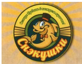
[1] « »

В решении Роспатента от 06.02.2021 обозначению по заявке №2019721048 противопоставлены следующие товарные знаки.