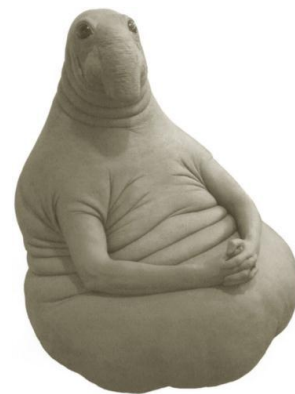
Противопоставленный промышленный образец (1)

В качестве основания для отказа в государственной регистрации товарного знака по заявке №2017726397 в заключении по результатам экспертизы отмечено, что заявленное обозначение сходно до степени смешения с промышленным образцом, зарегистрированным под №106883– (1), с конвенционным приоритетом от 07.03.2017, патентообладателем которого является Маргрит А. ван Бреворт.