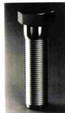
(рег. № 614840)

На основании изложенного в возражении заявителем была выражена просьба об изменении решения Роспатента и регистрации заявленного обозначения в качестве товарного знака без указания в качестве неохраняемого элемента «внешних контуров формы упаковки».