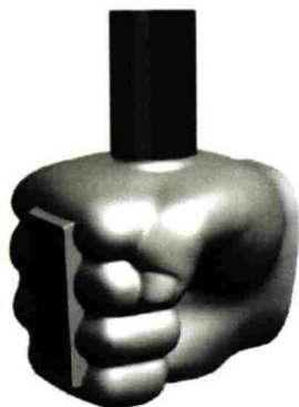
(рег. № 692125)